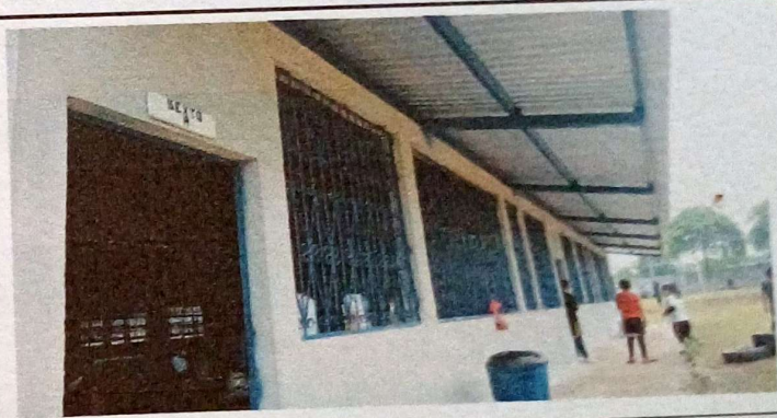
Foto 4: Se puede observar que las costaneras ya estan instalados.