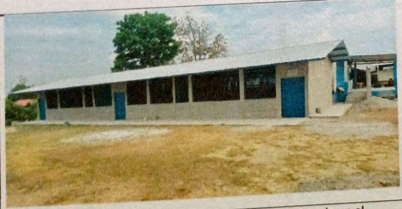
Foto 5: Aquí finaliza el 100% del remozamiento ya ejecutado en el Establecimiento Educativo de la aldea el Naranjal.