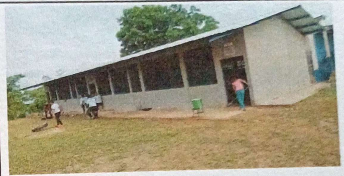
Foto 2: En este proceso se realizó el cambio de pared de la aulas del Centro Educativo.